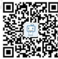
233 网校 学霸君

加一级消防工程师学霸君微信号: ks233wx1, 回复“消防考试”进入 233 网校一级消防备考微信群, 报考、资料、试题及时收到!