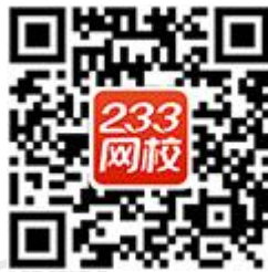
233 网校 APP