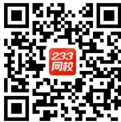
233 网校 APP